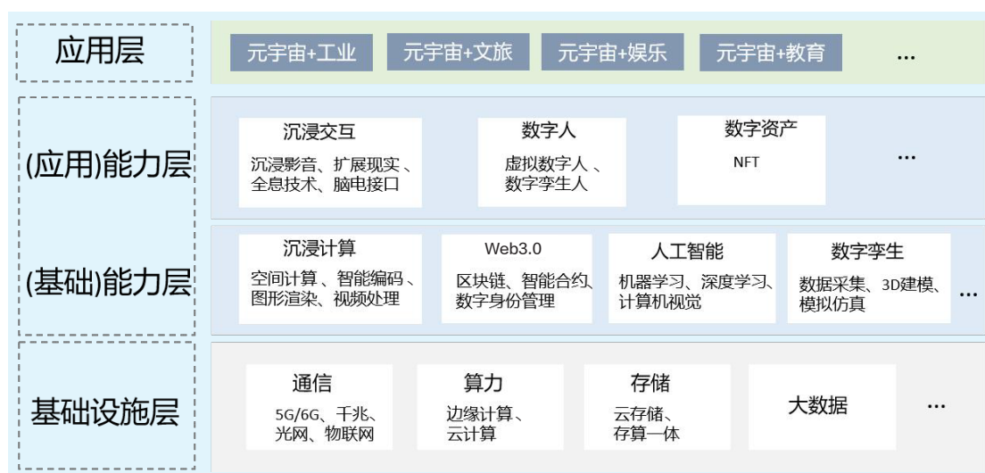
图1 元宇宙技术体系架构图